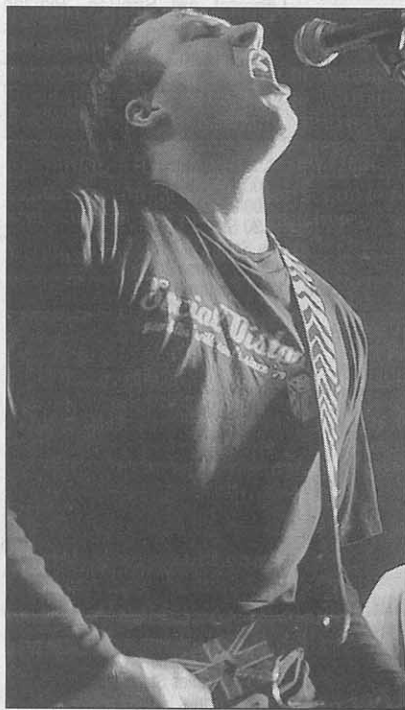
Special Gue$t: Nico.

Selbst als die Boxen ausgesteckt waren und die Gitarrenseiten schon lange nicht mehr schwangen, feierten die Kaff-Rocker noch immer.