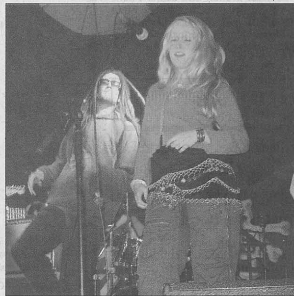
Medassi überzeugten mit Reggae-Sound.

Einen Haken hat Kaffrock allerdings: Die Veranstalter haben sich heuer selbst übertroffen und werden Probleme haben, dieses Angebot im nächsten Jahr noch zu toppen.